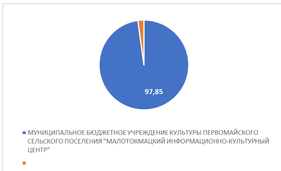
Рисунок 2 – Интегральный показатель по критерию «Комфортность условий предоставления услуг»

По второму критерию «Комфортность условий предоставления услуг» МУНИЦИПАЛЬНОЕ БЮДЖЕТНОЕ УЧРЕЖДЕНИЕ КУЛЬТУРЫ ПЕРВОМАЙСКОГО СЕЛЬСКОГО ПОСЕЛЕНИЯ "МАЛОТОКМАЦКИЙ ИНФОРМАЦИОННО-КУЛЬТУРНЫЙ ЦЕНТР" набрало 97,86 балла (Рис.2).