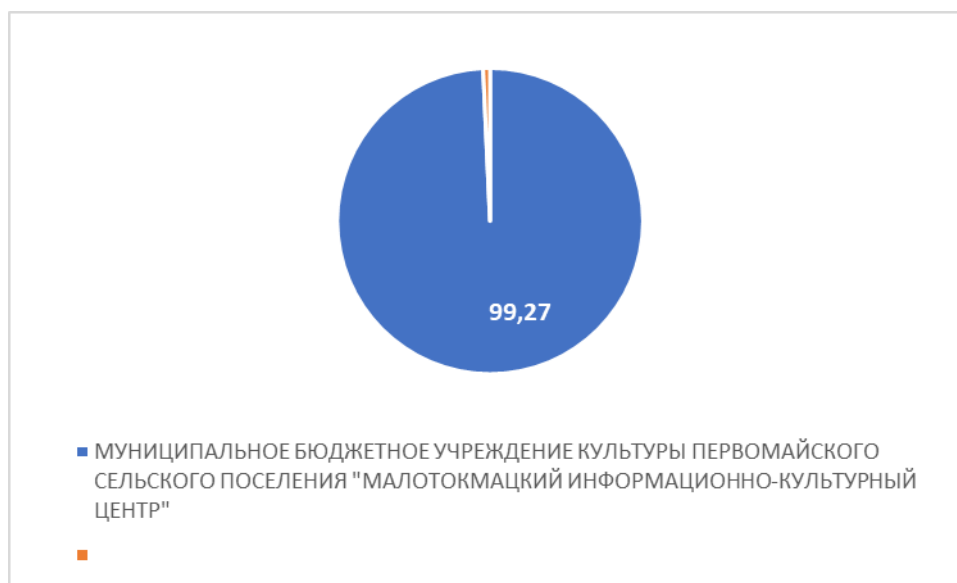
Рисунок 4 – Интегральный показатель по критерию «Доброжелательность, вежливость работников организации»

По четвертому критерию «Доброжелательность, вежливость работников организации» МУНИЦИПАЛЬНОЕ БЮДЖЕТНОЕ УЧРЕЖДЕНИЕ КУЛЬТУРЫ ПЕРВОМАЙСКОГО СЕЛЬСКОГО ПОСЕЛЕНИЯ "МАЛОТОКМАЦКИЙ ИНФОРМАЦИОННО-КУЛЬТУРНЫЙ ЦЕНТР" набрало 99,27 балла (Рис. 4).