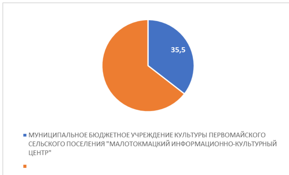
Рисунок 3 – Интегральный показатель по критерию «Доступность услуг для инвалидов»

По третьему критерию «Доступность услуг для инвалидов» МУНИЦИПАЛЬНОЕ БЮДЖЕТНОЕ УЧРЕЖДЕНИЕ КУЛЬТУРЫ ПЕРВОМАЙСКОГО СЕЛЬСКОГО ПОСЕЛЕНИЯ "МАЛОТОКМАЦКИЙ ИНФОРМАЦИОННО-КУЛЬТУРНЫЙ ЦЕНТР" набрало 35,50 балла (Рис.3).