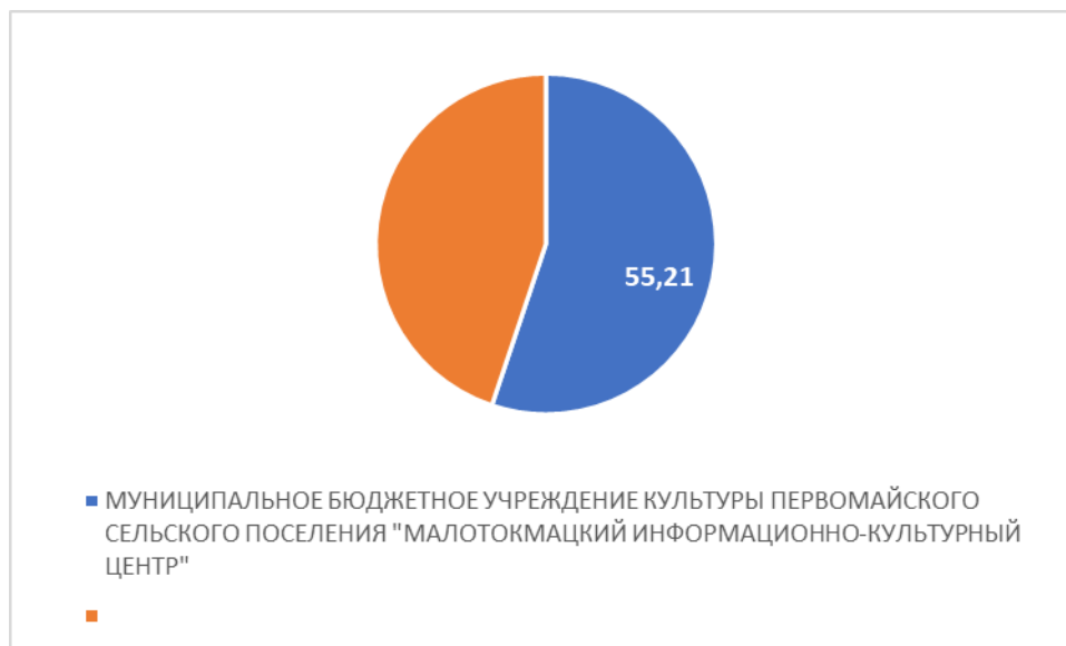
Рисунок 1 – Интегральный показатель по критерию «Открытость и доступность информации об организации культуры»

По первому критерию «Открытость и доступность информации об организации культуры» МУНИЦИПАЛЬНОЕ БЮДЖЕТНОЕ УЧРЕЖДЕНИЕ КУЛЬТУРЫ ПЕРВОМАЙСКОГО СЕЛЬСКОГО ПОСЕЛЕНИЯ "МАЛОТОКМАЦКИЙ ИНФОРМАЦИОННО-КУЛЬТУРНЫЙ ЦЕНТР" набрало 55,21 балла (Рис.1).